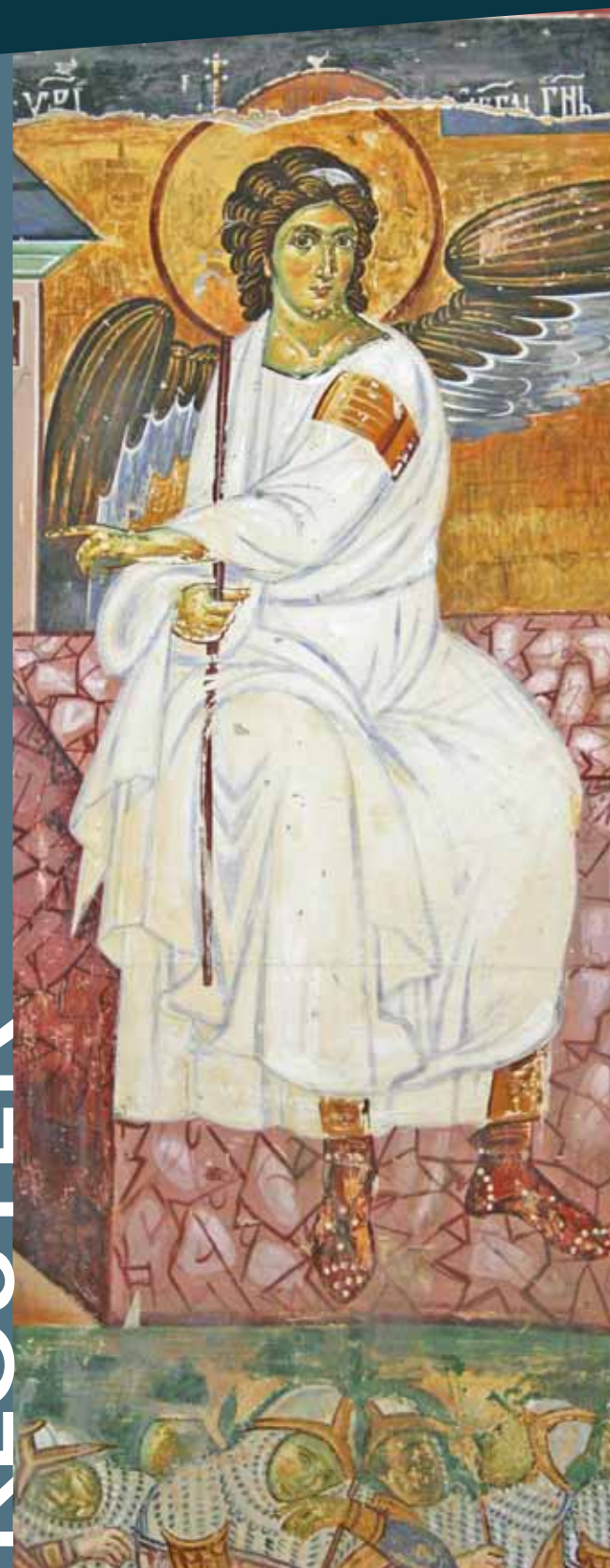
Das bekannteste serbische Fresko, der weiße Engel aus Mileseva, wurde erst mal im Jahr 1963 über Satellit als die europäische Begrüßung nach Amerika ausgestrahlt. Etwas später wurde das gleiche Signal in den Weltraum geschickt.

In Serbien existieren mehr als zweihundert Klöster, von denen 54 zu Kulturdenkmälern erklärt wurden. Stari Ras (Alter Ras), Sopoani, Studenica und die serbischen Klöster in Kosovo und Metochien, wie die Deani, Graonica, Pe ka patrijaršija (Patriarchat von Pe) und Bogorodica Ljevska (Muttergottes von Ljevis) stehen außerdem auf der Liste des UNESCO-Weltkulturerbes. Bekannt für ihr wichtiges kulturelles und geistiges Erbe sind sie von nachhaltigem Wert für die europäische Geschichte und wahrlich für die ganze Welt.